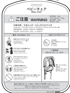
③ご使用方法ラベル