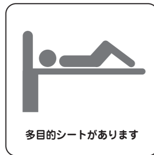
多目的シートがあります